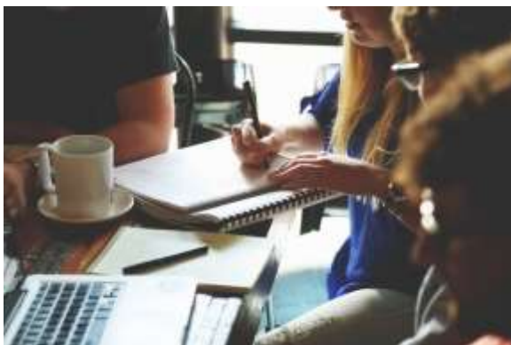
Foto 1. Grupidöö.

Autoriõiguste kohaselt on õppe-eesmärkidel teise autori foto (või mistahes muu teose) kasutamisel vaja viidata autorile (vt pildipankade viiteid peatükist 7). Kui avalikust pildipangast leitud foto juurde ei ole märgitud autori nime, võib viidata pildipanga nimele. Foto kasutamisel piisab vaid tekstisisesest viitamisest, kasutatud allikate loetellu ei pea viidet lisama.