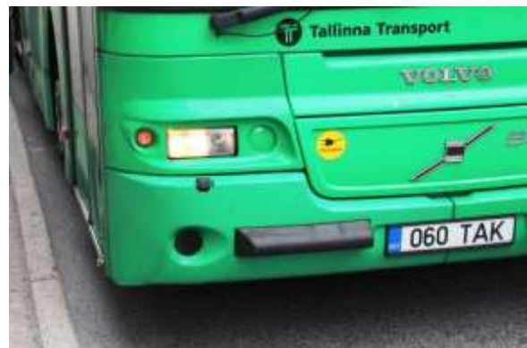
Foto 2. Tallinna ühistransport.